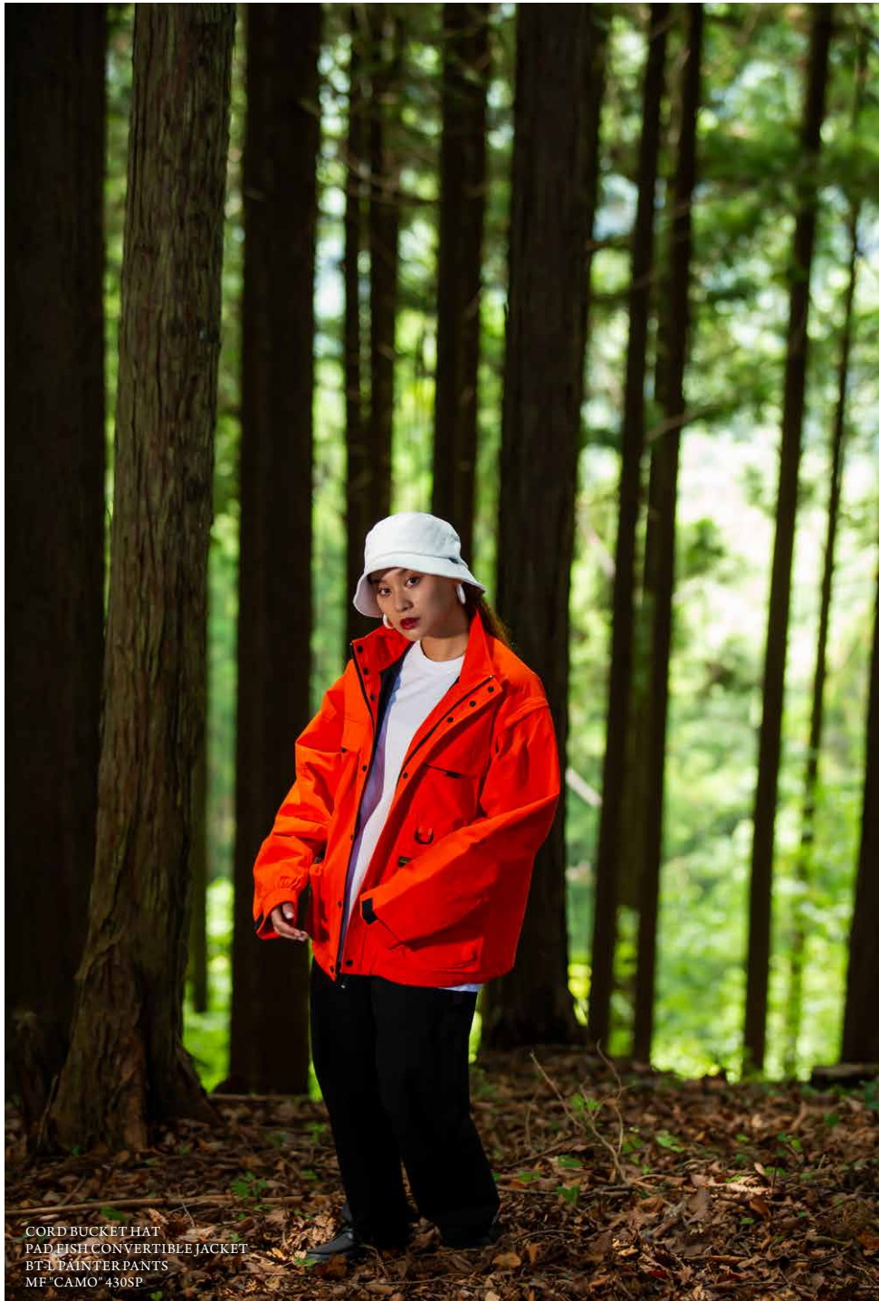
CORD BUCKET HAT PAD FISH CONVERTIBLE JACKET BT-L PAINTER PANTS MF "CAMO" 430SP