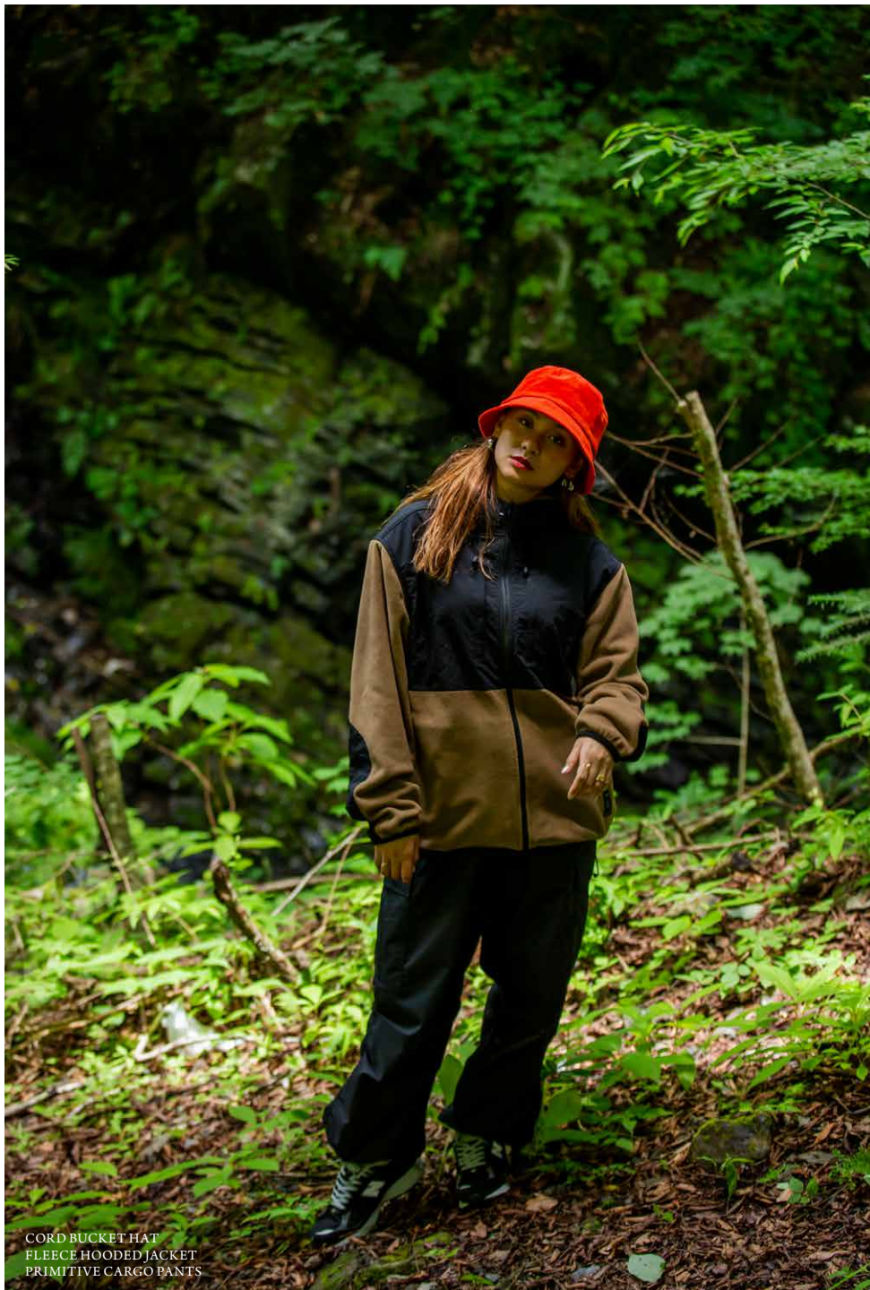
CORD BUCKET HAT FLEECE HOODED JACKET PRIMITIVE CARGO PANTS