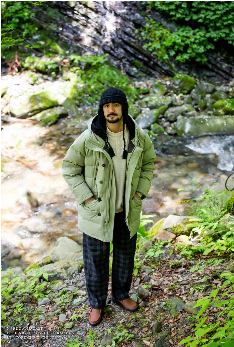
CUFF EAR BEANIE N-3B DOWN JACKET L/S HENRY NECK GRID THERMAL C&S BT L CORD CHECK CHINO MF BOO MID 430SP