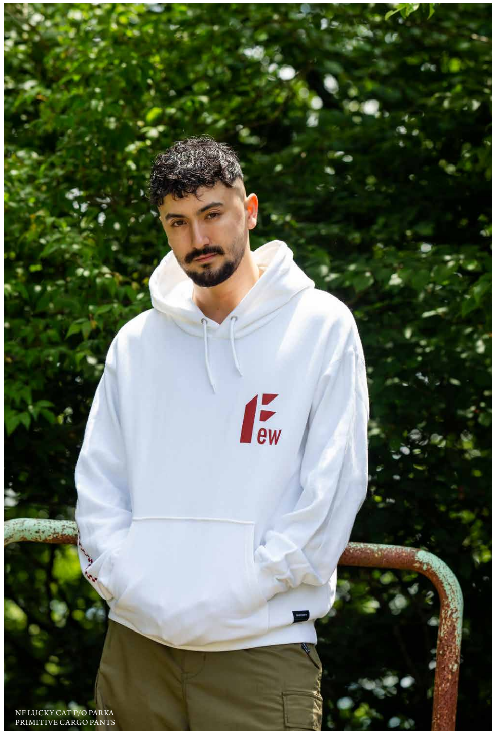
NF LUCKY CAT P/O PARKA PRIMITIVE CARGO PANTS