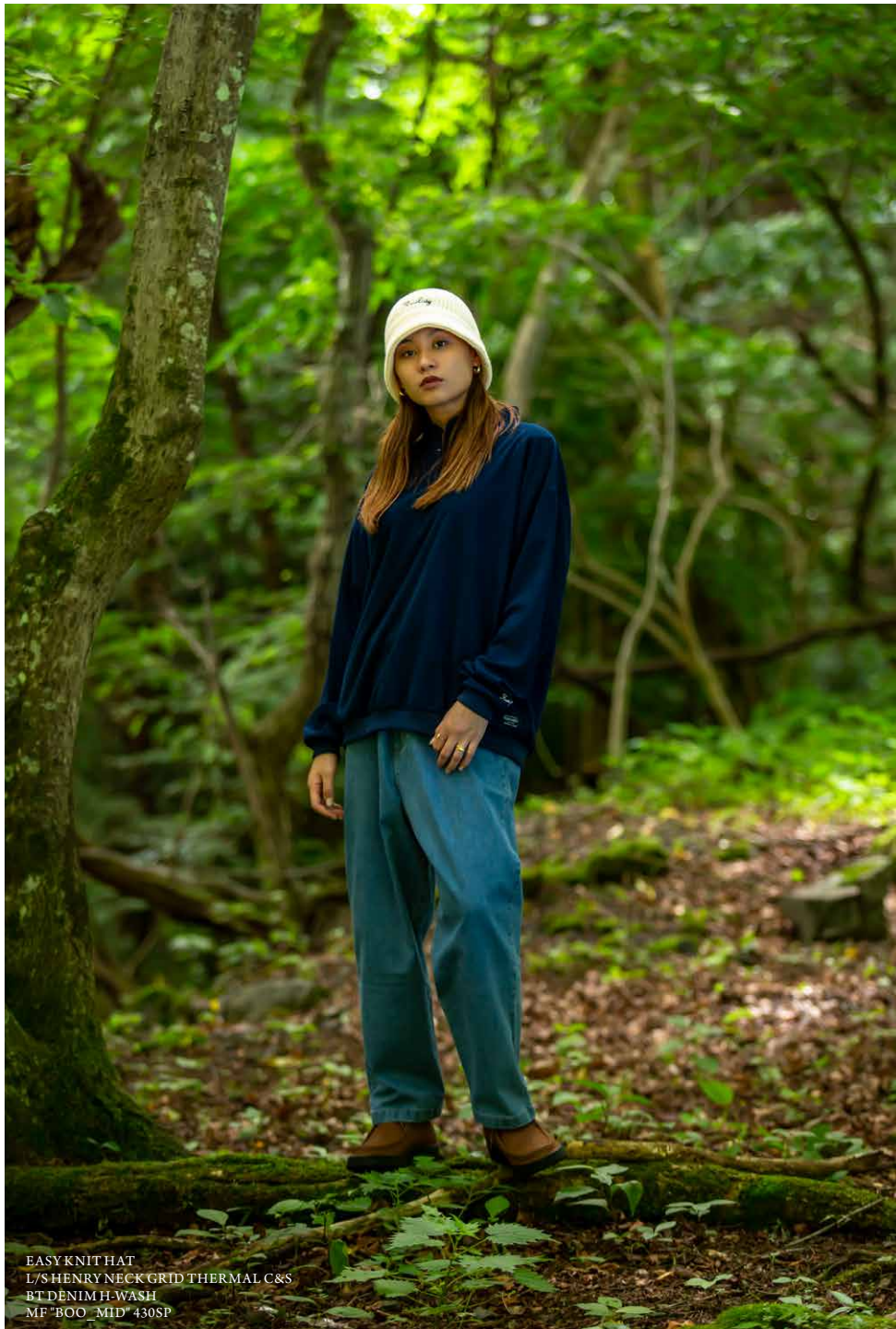
EASY KNIT HAT L/S HENRY NECK GRID THERMAL C&S BT DENIM H-WASH MF "BOO_MID" 430SP