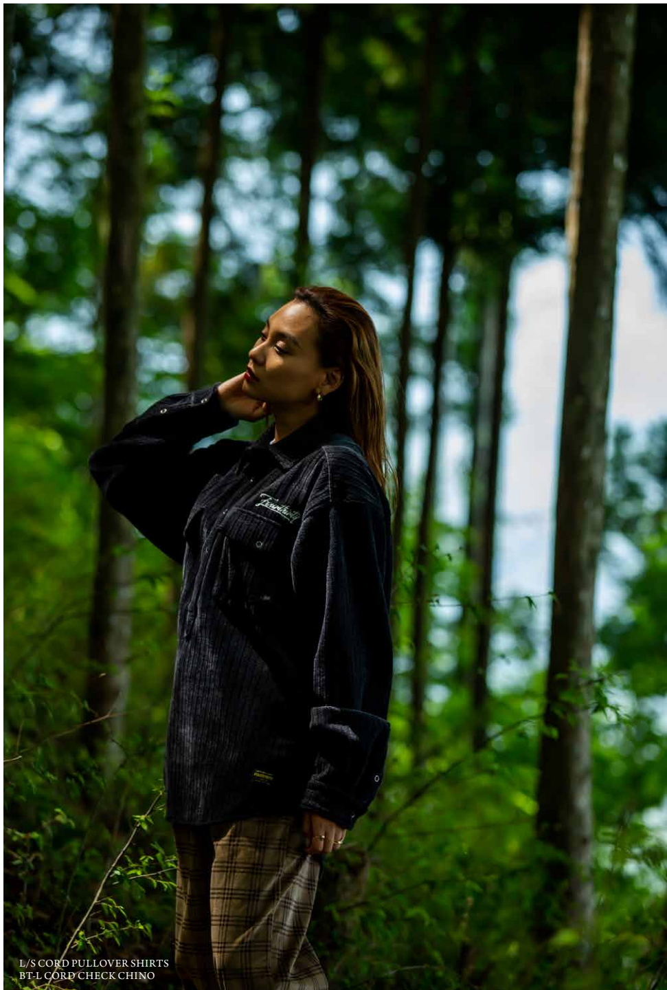
L/S CORD PULLOVER SHIRTS BT-L CORD CHECK CHINO