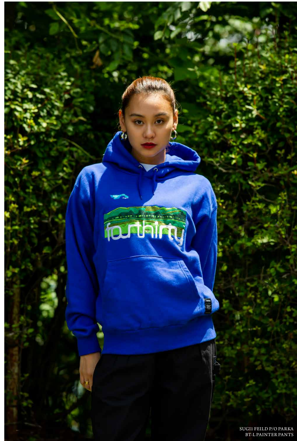
SUGII FEILD P/O PARKA BT-L PAINTER PANTS