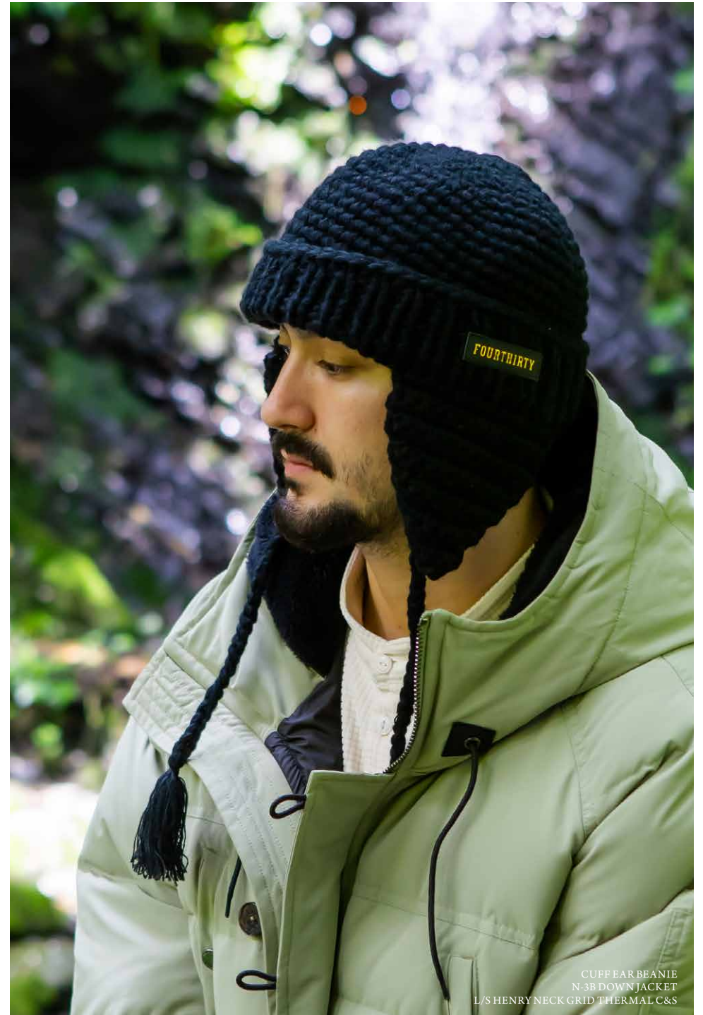
CUFF EAR BEANIE N-3B DOWN JACKET L/S HENRY NECK GRID THERMAL C&S