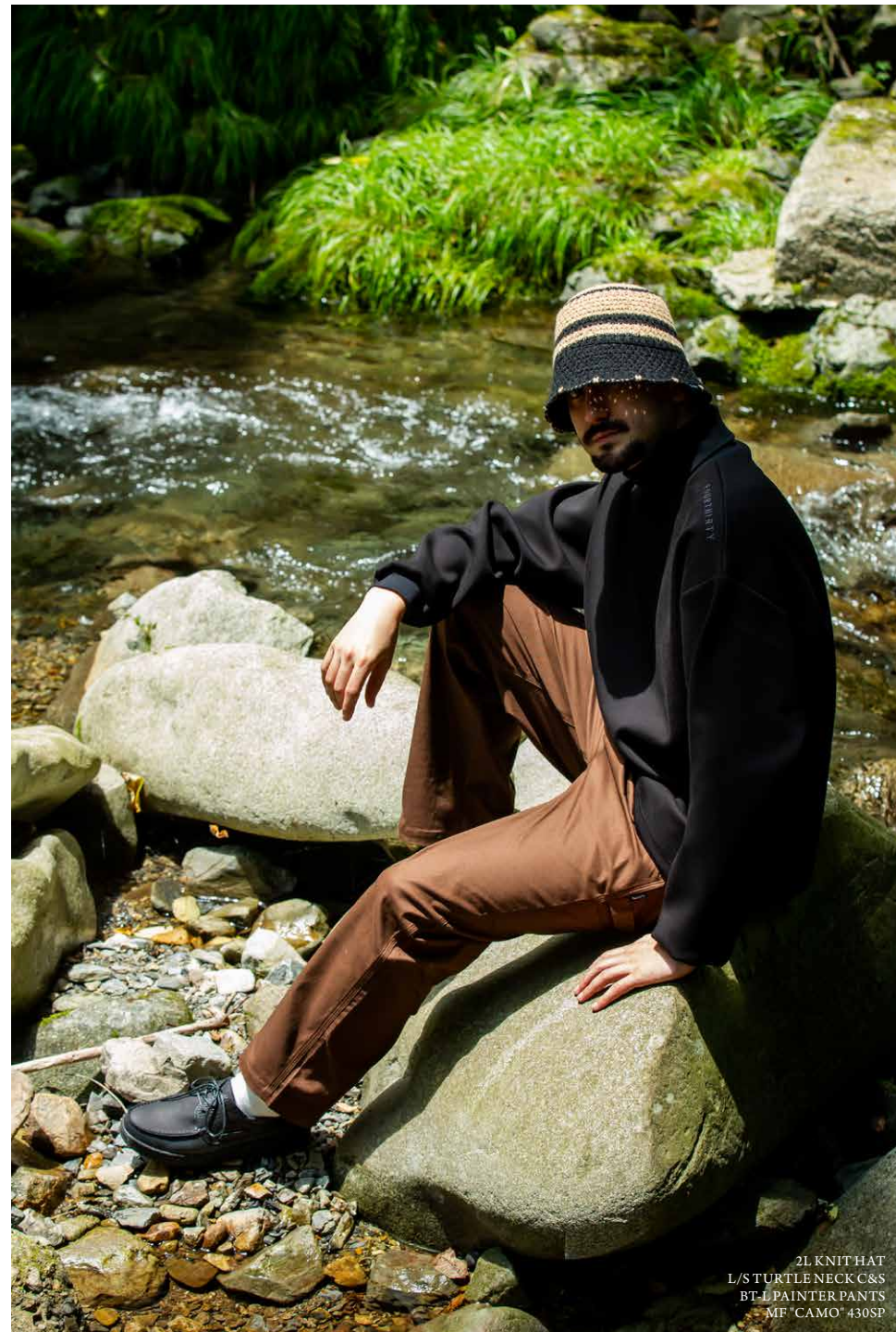
2L KNIT HAT L/STURTLNECK C&S BT L PAINTER PANTS MF "CAMO" 430SP