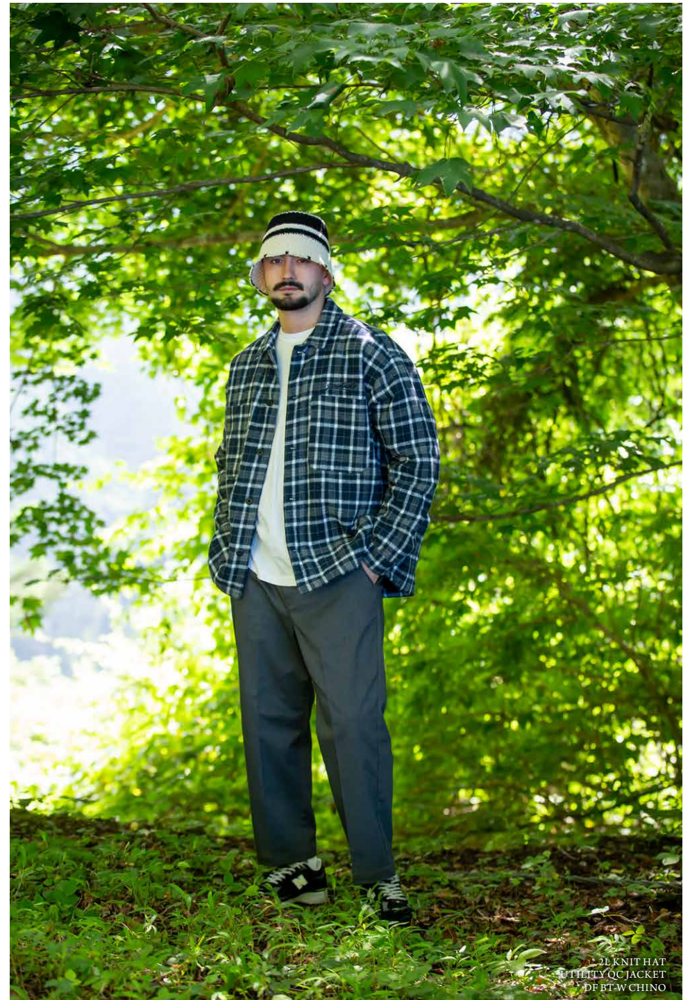
3L KNIT HAT UTILITY QC JACKET DF BT-W CHINO