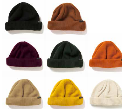
SHORTY BEANIE lot#: 23-180 color: BLK, GRY, CML, BGD, GRN, ORG, BGE, YEL, IVRY size: FREE price: ¥3,800 +tax delivery: 9

コットンアクリルを使用したシンプルな編み地のニットキャップです。薄手の起毛フリースを内側に走らせ、保温性も十分なアイテムです。