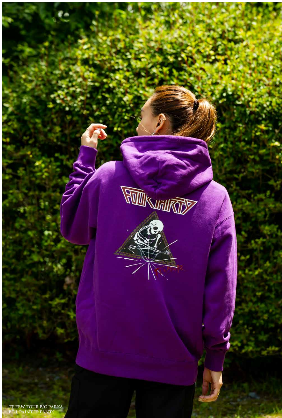
TF FEW TOUR P/O PARKA BT-L PAINTER PANTS