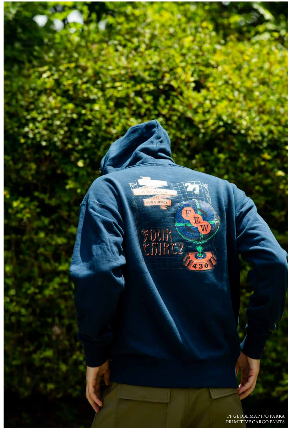
PF GLOBE MAP P/O PARKA PRIMITIVE CARGO PANTS