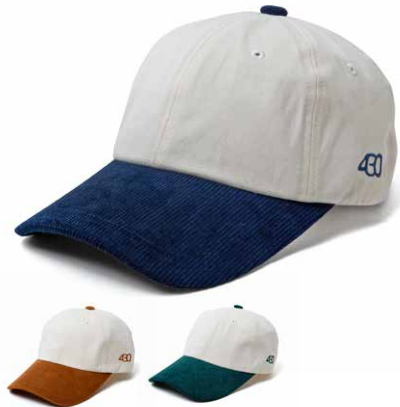
BI-COL CAP lot#: 23-175 color: BGE, NVY, GRN size: FREE price: ¥5,300 +tax delivery: 10

少し睡を長めにとったバイカラーのキャップです。落ち着いた発色の組み合わせでレトロなスポーティーさとカジュアルさを両立させた仕上がりです。