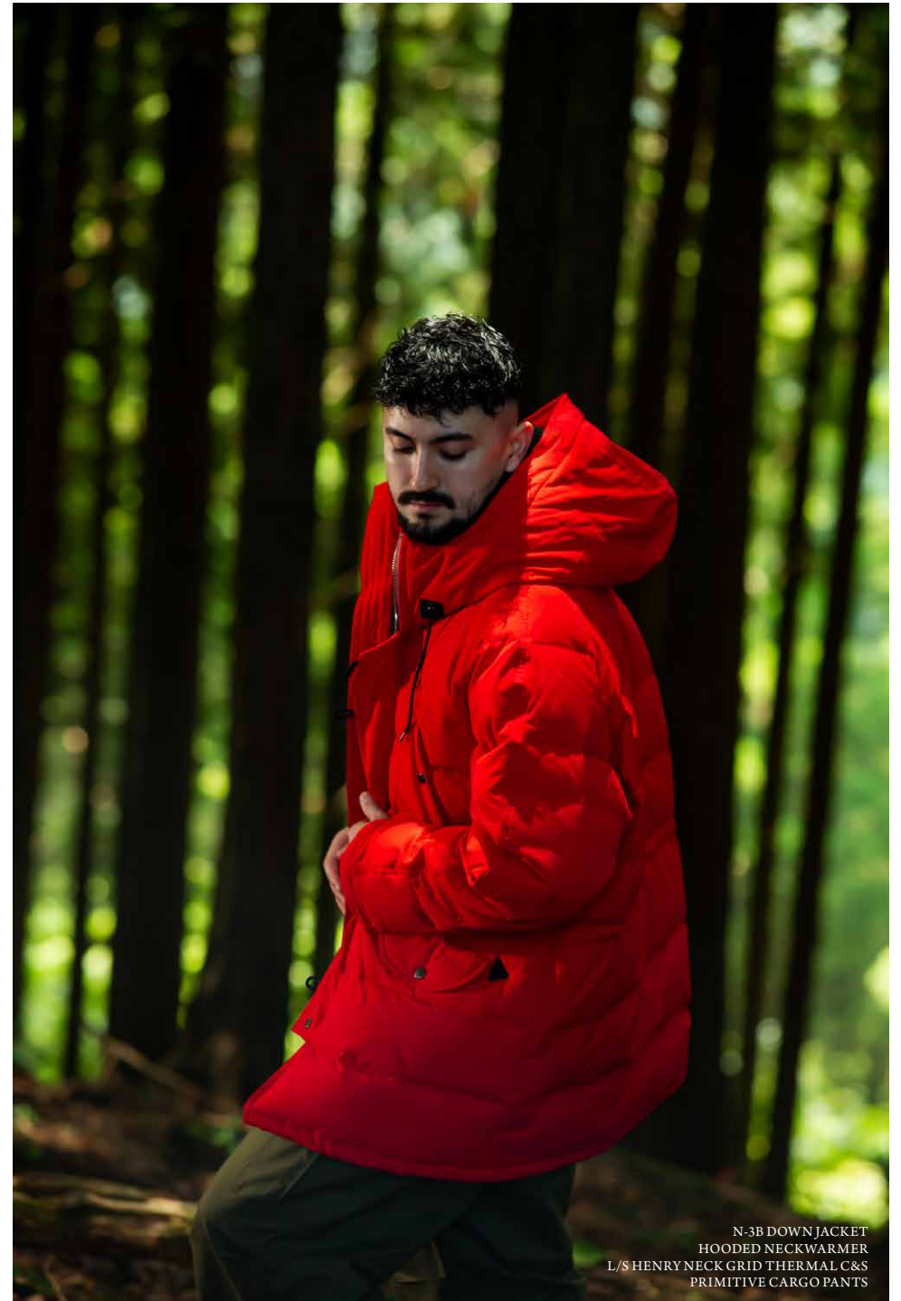
N-3B DOWN JACKET HOODED NECKWARMER L/S HENRY NECK GRID THERMAL C&S PRIMITIVE CARGO PANTS