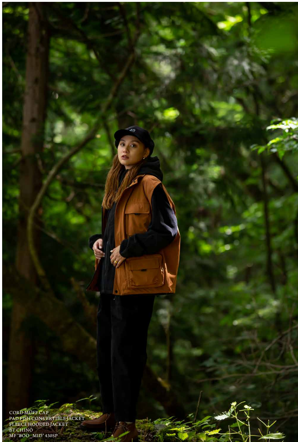
CORD MUFFLE CAP PAD PISH CONVERTIBLE JACKET FLEECE HOODED JACKET BT CHINO MF "BOO_MID" 430SP