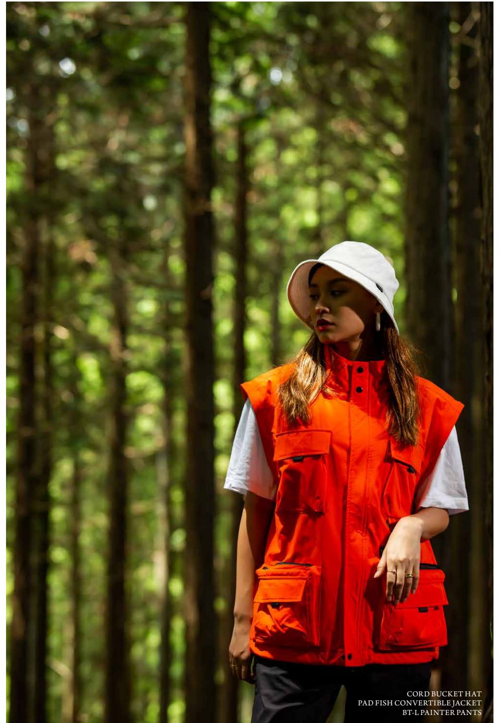
CORD BUCKET HAT PAD FISH CONVERTIBLE JACKET BT-L PAINTER PANTS