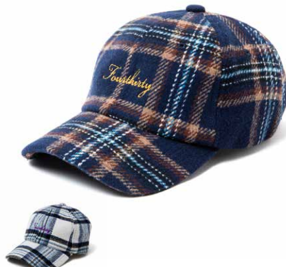
NEL CHECK CAP lot#: 23-176 color: NVY, IVRY size: FREE price: ¥5,300 +tax delivery: 9

少し睡を長めにとったバイカラーのキャップです。落ち着いた発色の組み合わせでレトロなスポーティーさとカジュアルさを両立させた仕上がりです。