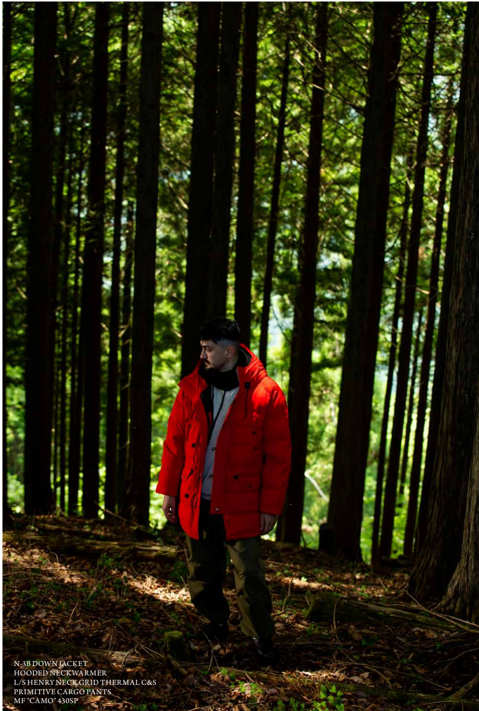
N-3B DOWN JACKET HOODED NECKWARMER L/S HENRY NECK GRID THERMAL C&S PRIMITIVE CARGO PANTS MF "CAMO" 430SP