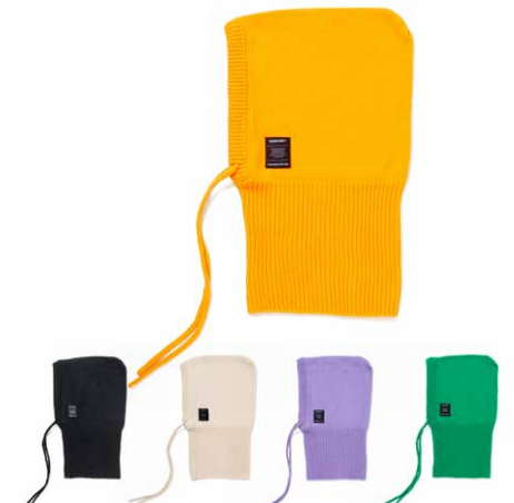
HOODED NECKWARMER lot#: 23-181 color: BLK, IVRY, ORG, PPL, GRN size: FREE price: ¥4,200 +tax delivery: 10

フードやネックウォーマーとして使えるニット素材のパラクラバです。ハイテク系とはまた違った表情で柔らかな素材のアウトターに合わせやすい仕上がりです。