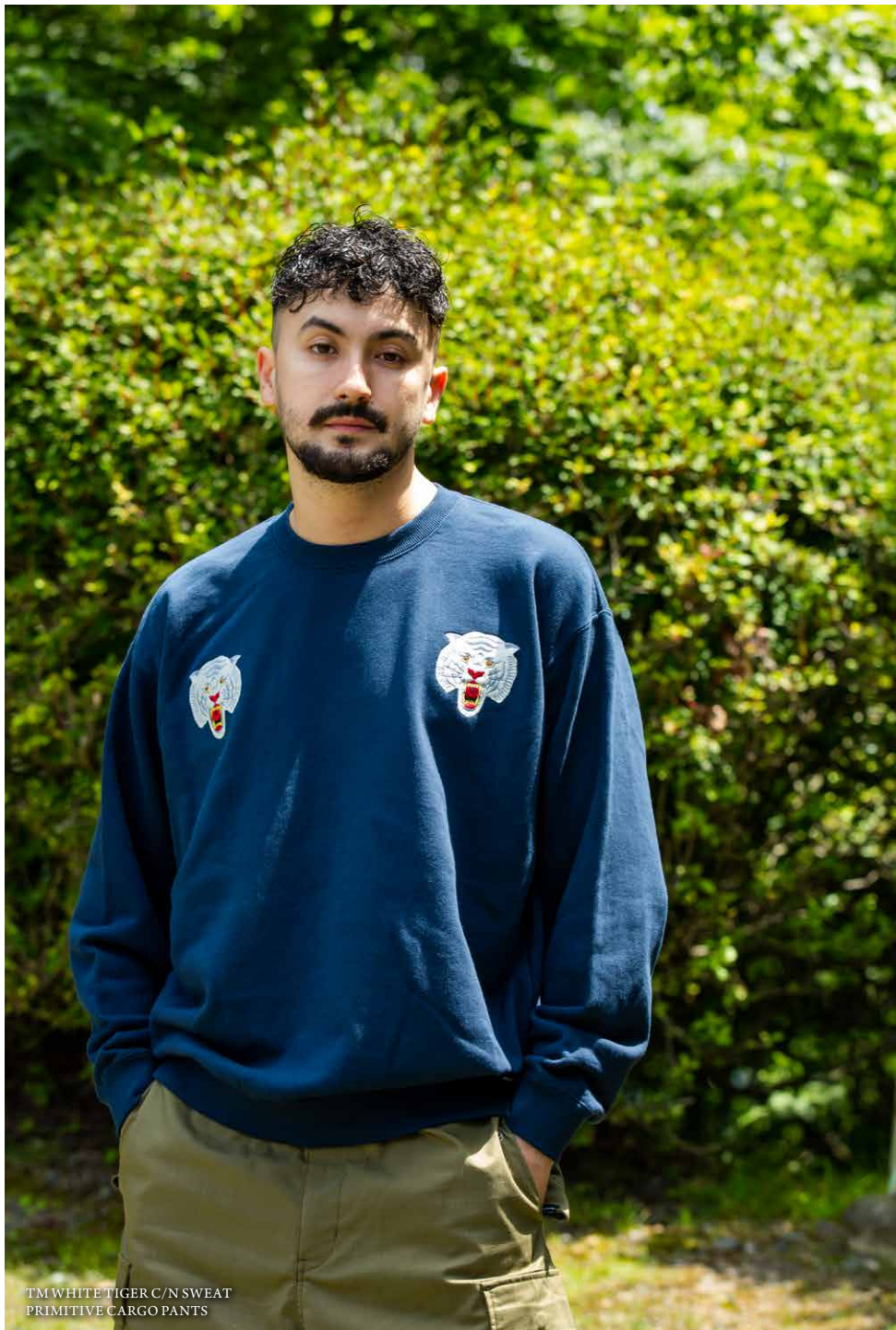
TM WHITE TIGER C/N SWEAT PRIMITIVE CARGO PANTS