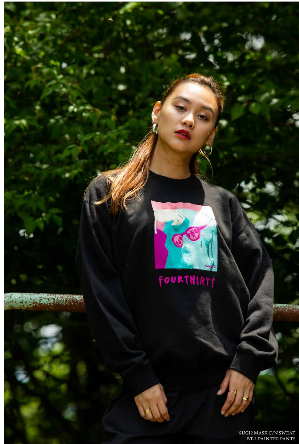
SUGI2 MASK C/N SWEAT BT-L PAINTER PANTS