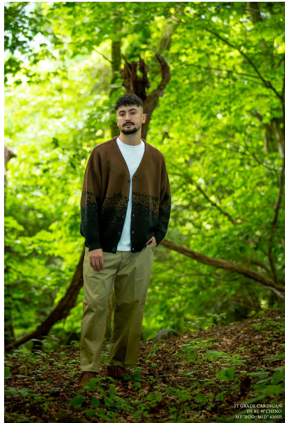
2T GRADE CARDIGAN DF BT-W CHINO MF "BOO_MID" 430SP