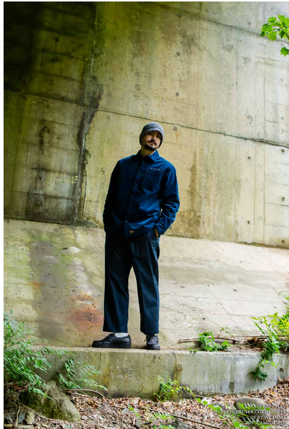
EASY KNIT HAT L/S FLEECE LINER CORD SHIRTS DF BT-W CHINO MF CAMO T30SP