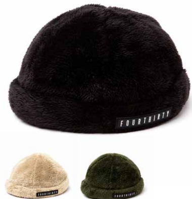
BOA FISHERMAN CAP lot#: 23-177 color: BLK, BGE, KHK size: FREE price: ¥5,200 +tax delivery: 9

一般的なローキャップより少し深さを出した6Pキャップです。シックなチェック生地を使用し、落ち着いたトーンでアクセントをつける仕上がりです。