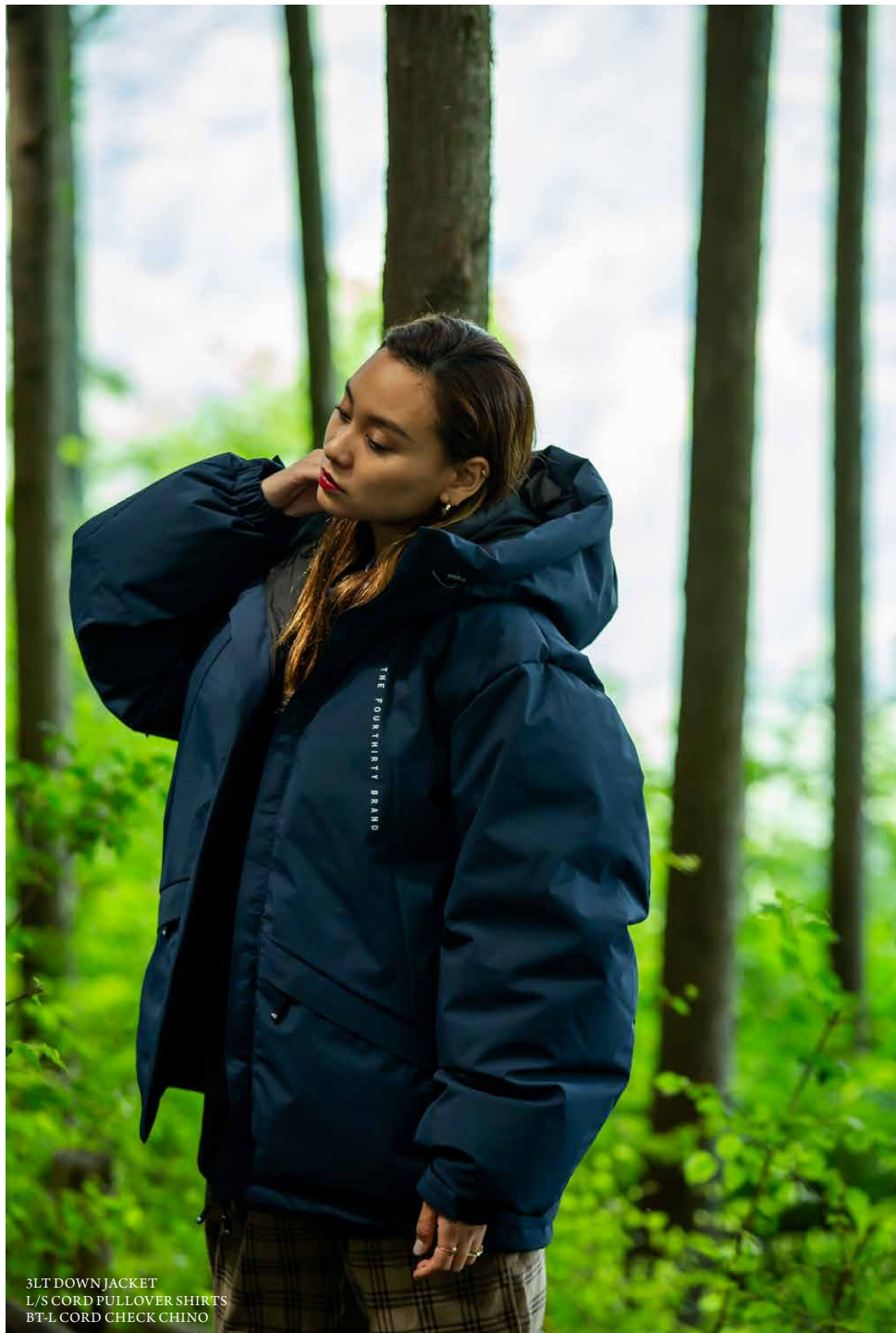
3LT DOWN JACKET L/S CORD PULLOVER SHIRT'S BT-L CORD CHECK CHINO