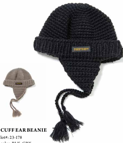
CUFF EAR BEANIE lot#: 23-178 color: BLK, GRY size: FREE price: ¥5,800 +tax delivery: 10

シャギーフリース素材を使用したフィッシャーマンタイプのキャップです。柔らかな素材感と保温性で秋冬に向けての提案的なアイテムです。