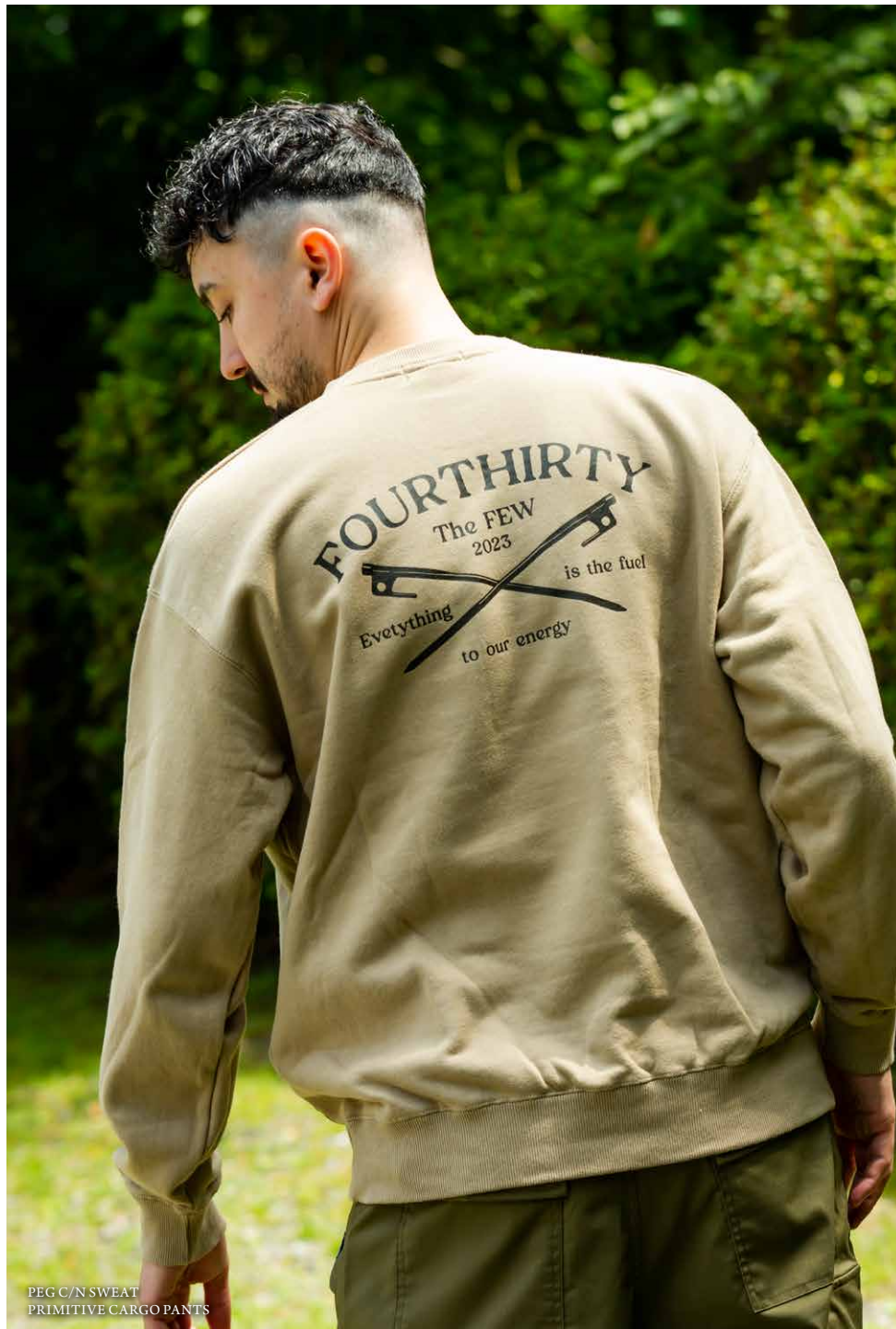
PEG C/N SWEAT PRIMITIVE CARGO PANTS