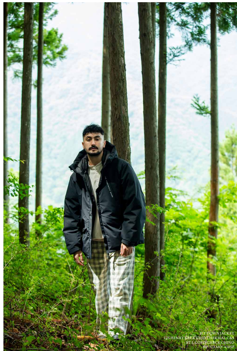
3LT DOWN JACKET L/S HENRY NECK GRID THERMAL C&S BT-L CORD CHECK CHINO MF "CAMO" 430SP